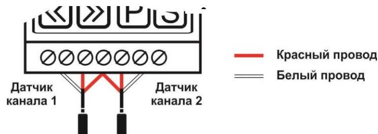
Рис. 1.1 Подключение термометров сопротивления типа Pt100, Pt50, ТСП-100Pi, ТСП-50Pi, ТСМ-50М по трехпроводному способу.